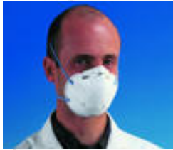
3M™ 8810 Stofmasker FFP2 Standaard stofmaskers Goedkeuringen: CE-markering