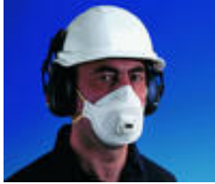
3M™ 9312 Stofmasker FFP1 Extra comfortabele stofmaskers Goedkeuringen: CE-markering