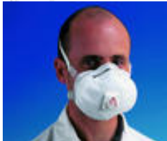
3M™ 8835 Stof/nevel/metaaldamp-masker FFP3 Premium stofmaskers Goedkeuringen: CE-markering