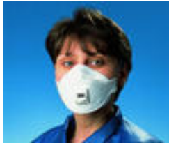
3M™ 9322 Stofmasker FFP2 Extra comfortabele stofmaskers Goedkeuringen: CE-markering