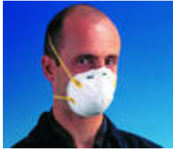
3M™ 8710E Stofmasker FFP1 Standaard stofmaskers Goedkeuringen: CE-markering