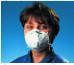
3M™ 8822 Stofmasker FFP2 Standaard plus stofmaskers Goedkeuringen: CE-markering