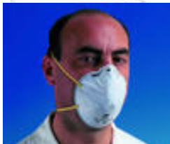
3M™ 9906 Stofmasker met bescherming tegen hinderlijk HF-gas FFP1 Specifieke stofmaskers Goedkeuringen: CE-markering