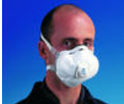
3M™ 8825 Stof/nevelmasker FFP2 Premium stofmaskers Goedkeuringen: CE-markering