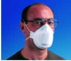
3M™ 9310 Stofmasker FFP1 Extra comfortabele stofmaskers Goedkeuringen: CE-markering