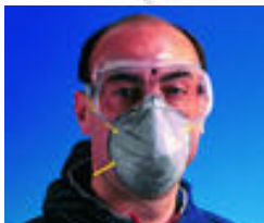
3M™ 9913 Stofmasker met bescherming tegen hinderlijke geuren FFP1 Specifieke stofmaskers Goedkeuringen: CE-markering