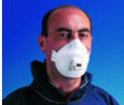
3M™ 9332 Stofmasker FFP3 Extra comfortabele stofmaskers Goedkeuringen: CE-markering