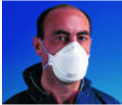
3M™ 9320 Stofmasker FFP1 Extra comfortabele stofmaskers Goedkeuringen: CE-markering