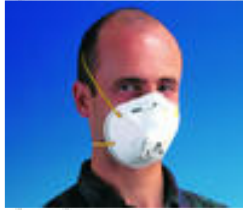
3M™ 8812 Stofmasker FFP1 Standaard plus stofmaskers Goedkeuringen: CE-markering